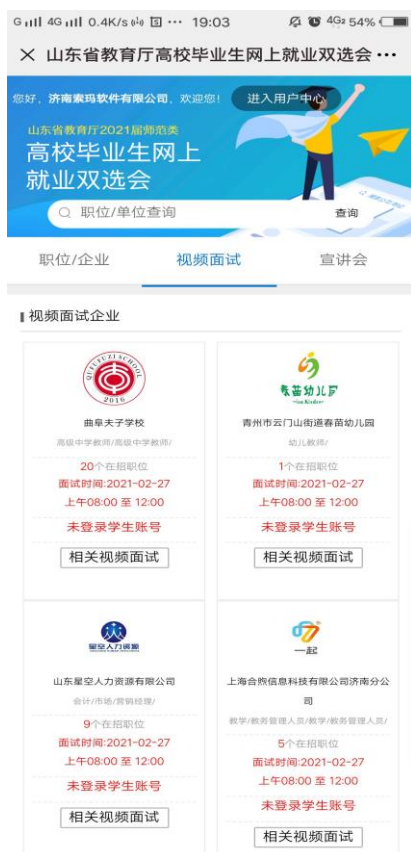
图 7：视频面试单位列表

为达到较好的面试效果，视频面试前，请确保电脑、手机、iPad 等设备网络畅通。有完好的摄像头和音频设备。请尽量选择清晰整洁的背景，避免面试过程中泄露隐私。