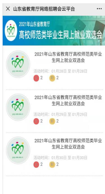
图 6：网上就业双选会首页面

（二）学生投递简历。访问“山东就业创业导航”中的网上就业双选会栏目（图 5、6），查询用人单位发布的职位，并向意向单位投送简历。