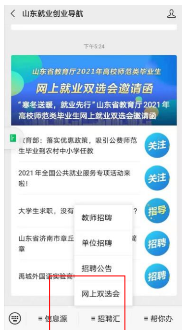
图 5：“山东就业创业导航”