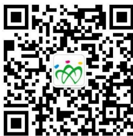
图 4：“山东就业创业导航”微信平台二维码

（一）登录。用人单位、学生扫描“山东就业创业导航”二维码（图 4）进行登录。“山东就业创业导航”微信平台对全省师范类学生（不含省属师范生）提供双选会服务。